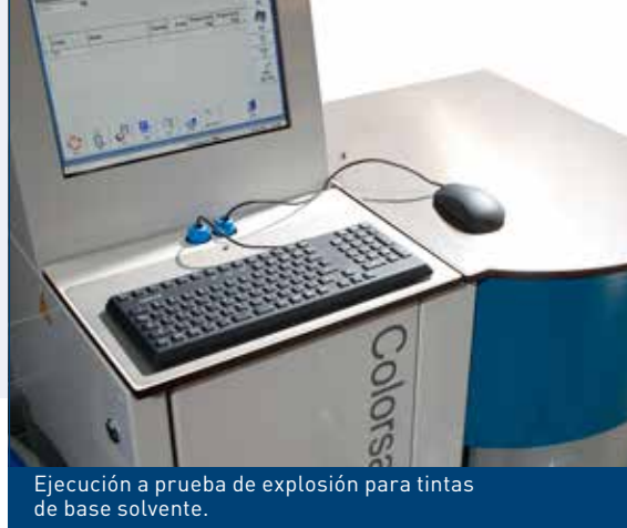
Ejecución a prueba de explosión para tintas de base solvente.