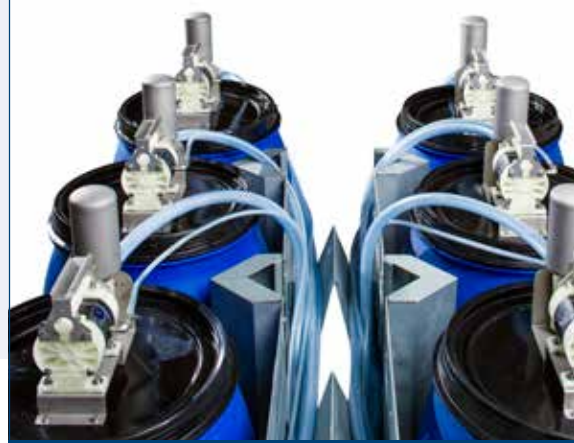
Soporte modular y flexible para bombas y mangueras.

El dosificador Slim, fabricado con la tecnología probada de dosificación de tintas GSE, le ofrece la máxima fiabilidad, velocidad y precisión. Gracias a su