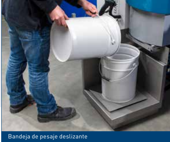
Bandeja de pesaje deslizante